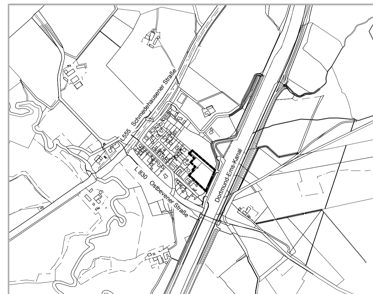
Übersichtsplan 1 : 10000