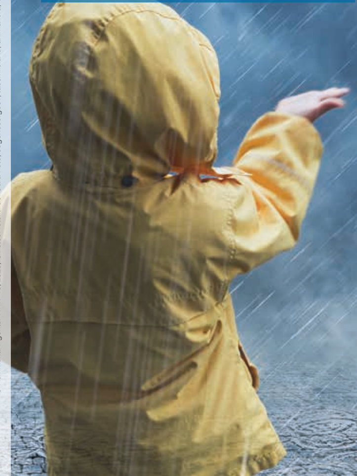
© Kommunal Agentur NRW 10/2020

Hinweise und Empfehlungen zum Schutz für sich und andere